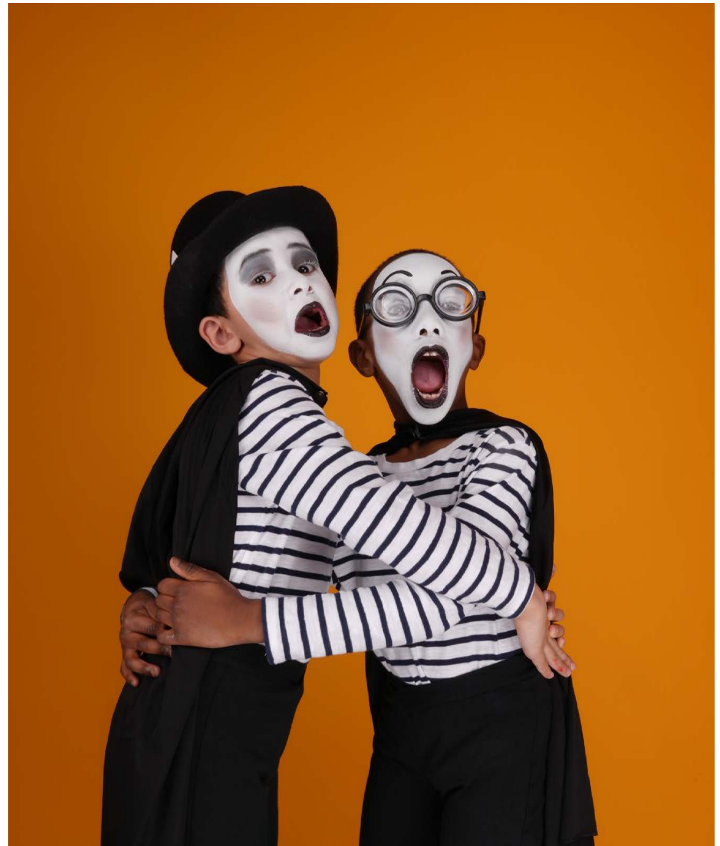
Surpris en flagrant délit, les voleurs prennent immédiatement la fuite !