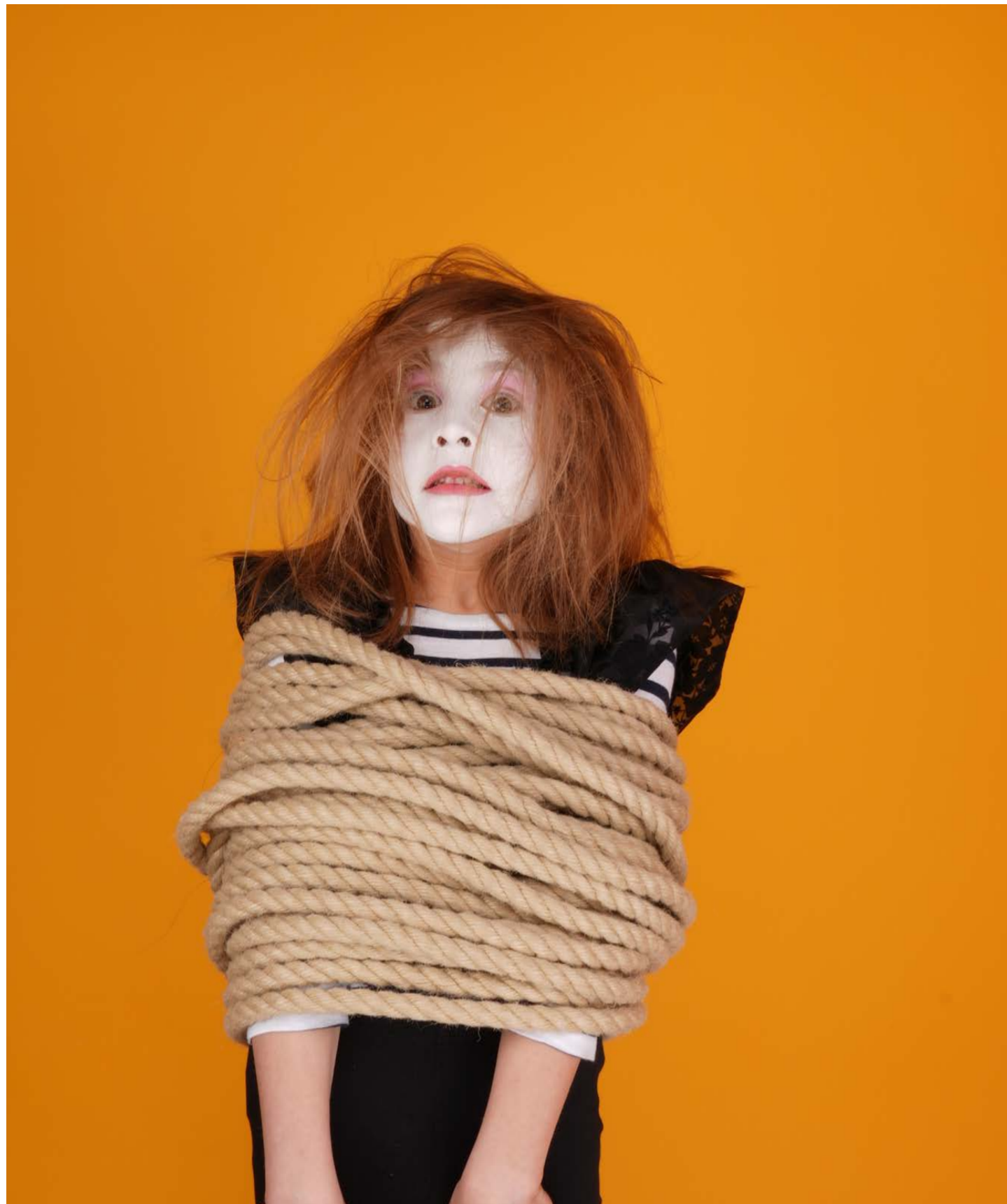
Et juste derrière eux... La Joconde, ligotée !